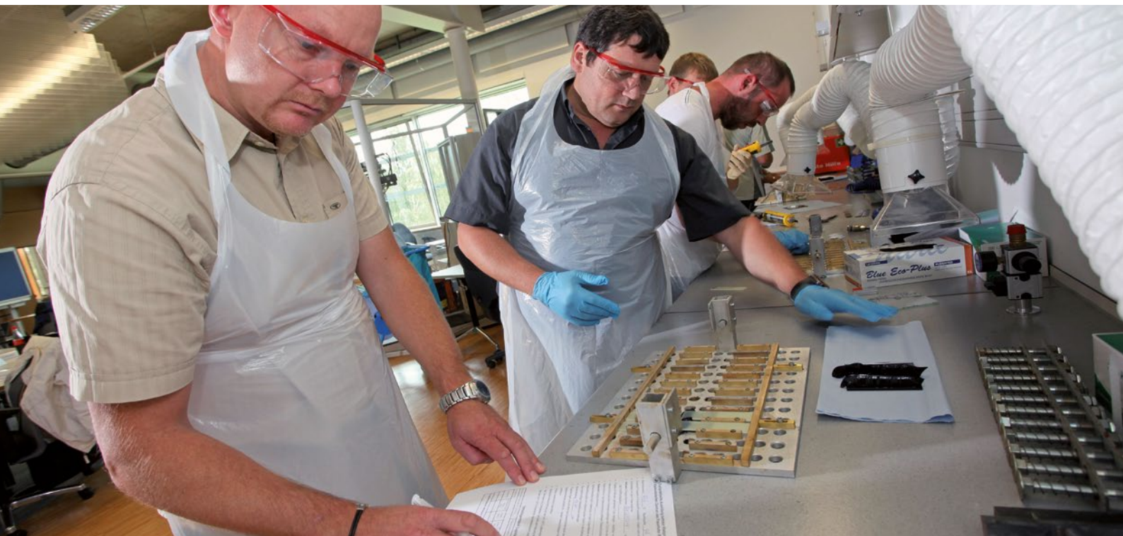
Herstellung von Klebproben.